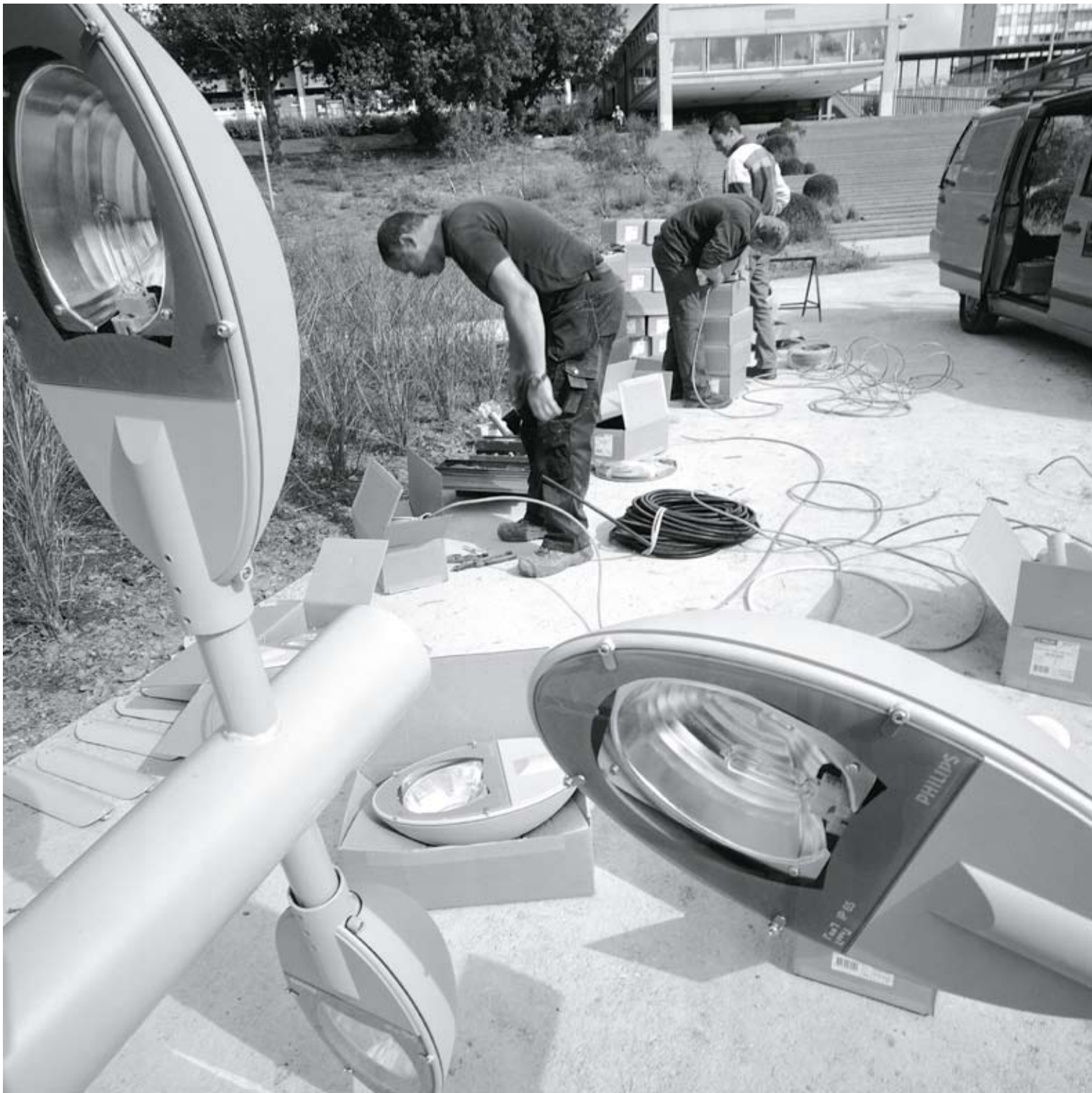
Lakense Haard - Modelwijk, plaatsen van de straatlantaarns Le Foyer Laekenois - Cité Modèle, installation des réverbères