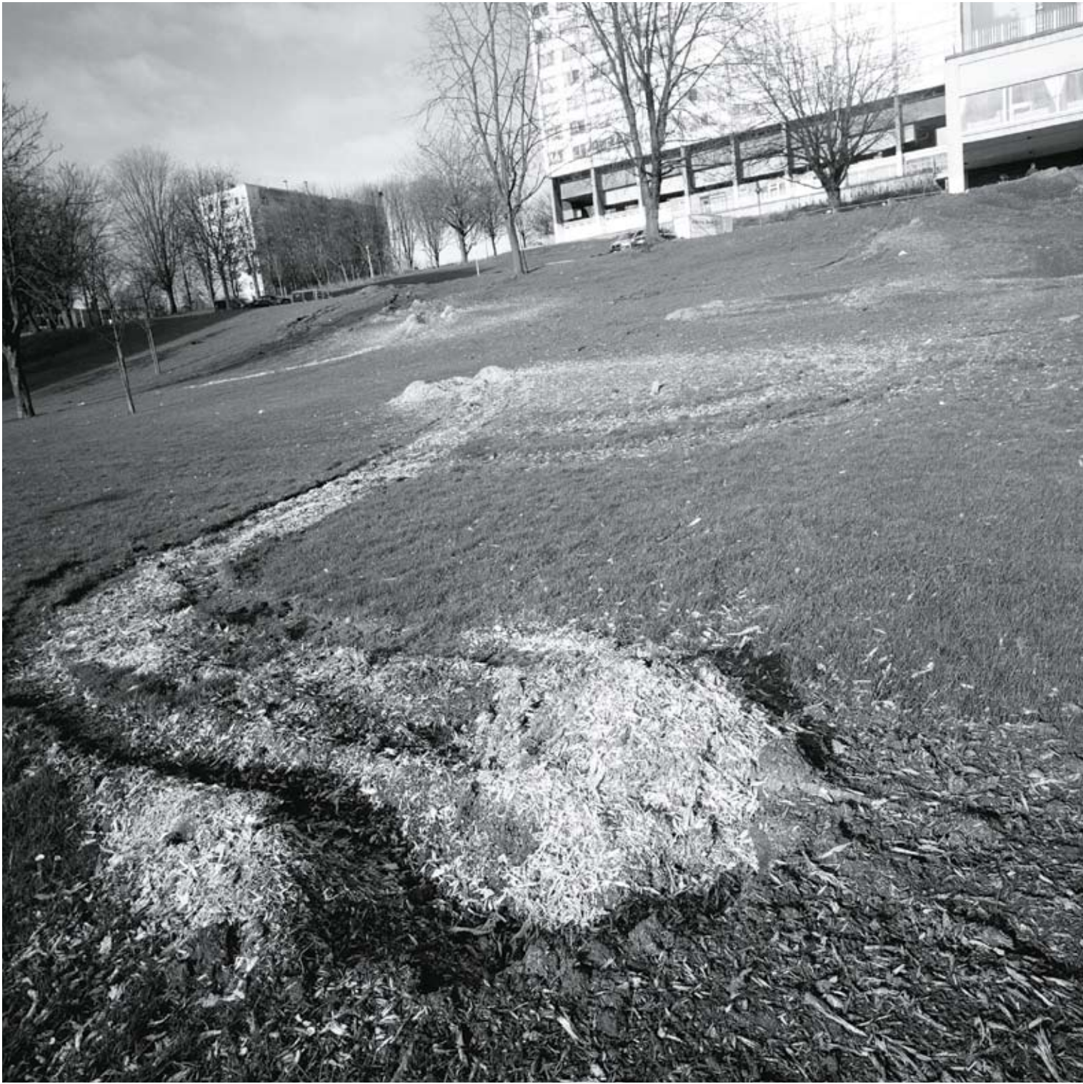
Le Foyer Laekenois - Cité Modèle, jardin en construction Lakense Haard - Modelwijk, tuin in aanbouw